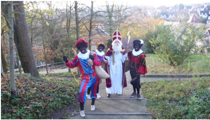
Aankomst van Sinterklaas waar velen zo naar uitzagen.....

Sinterklaas en zijn drie knechten waren dit jaar in goede vorm. De oorzaak daarvan is dat zij de Nederlandse afdeling bezochten voor de verjaardag van de Sint, en niet op de terugtocht naar Spanje.