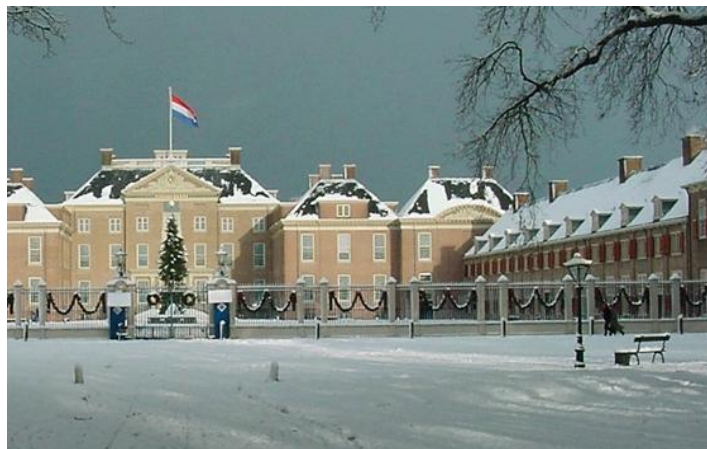
Paleis "Het Loo" te Apeldoorn, winters aanzicht