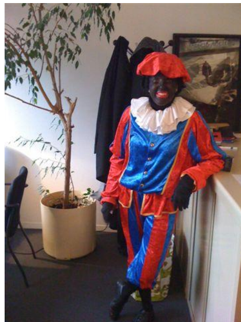
Zwarte Piet even op kantoor