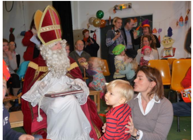
Sinterklaas met een andere jarige, van één jaar.