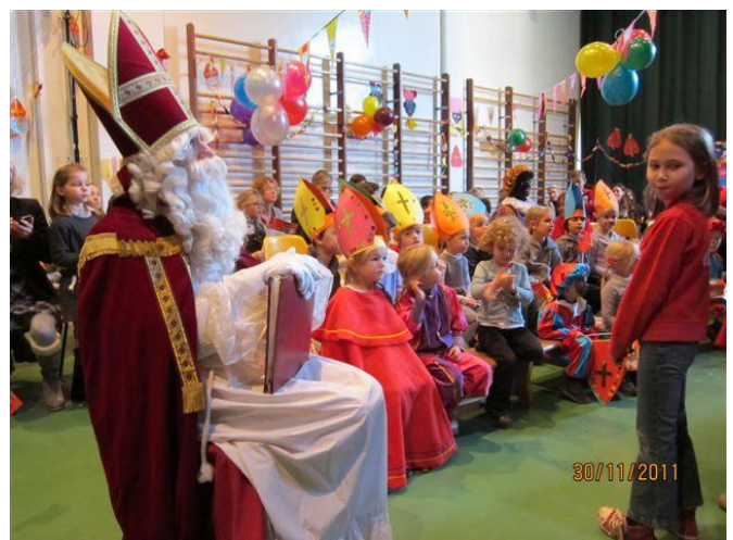
Meer aandacht voor de fotograaf?