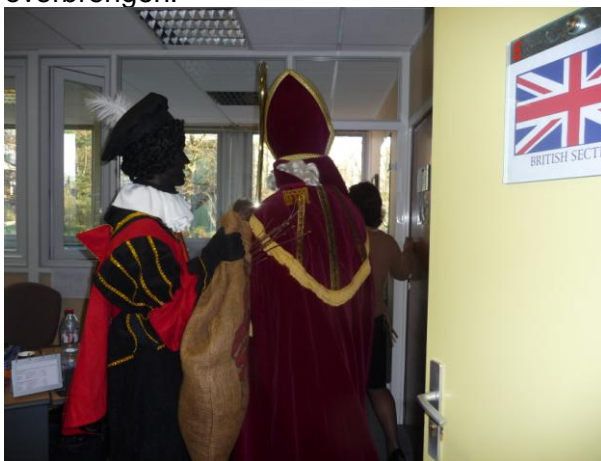
Sinterklaas en zijn knechten vallen het Kantoor van de Britse afdeling binnen.

Wij danken Sinterklaas voor zijn komst. Ook de leden van het ontvangstcomité, bestaand uit de leden van het Bestuur van de Oudervereniging, maar ook alle "versier- en opruimouders", willen wij als team nogmaals onze complimenten, onze dank en onze waardering overbrengen.